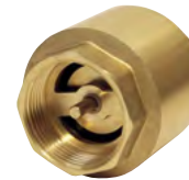
Spätný ventil K-1039K

Sortiment Sloplastu rozširujeme o nové nerezové sifóny štandardné aj dizajnové, v hranatom aj oblom tvare, ktoré sú momentálne medzi zákazníkmi obľúbené. Pribudnú tiež nové „soft close“ WC sedadlá, ELLA – sedadlo s detskou vložkou a AGATA – dizajnové „slim“ sedadlo.